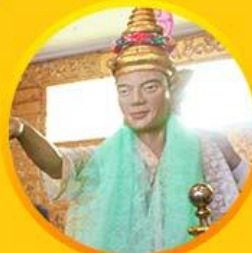
ขอพรเทพทันใจ