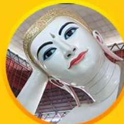
พระนอนตาทาว