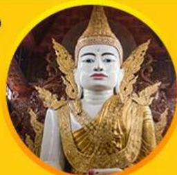
พระพุทธรูปหงากัตตี