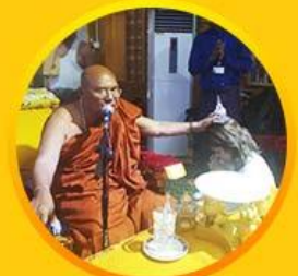
วัดบารมี